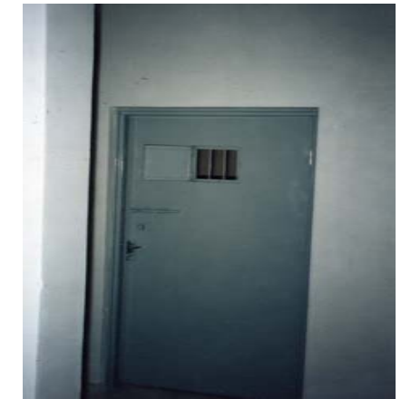
ژوررى تاك (الانفرادى)

گويم لېبوو يەك يەك هەموو دەرگاكان لەسەرم داخرايەو، بەردەم ئەو ريزە ژوررە ھۆلېكى لېبوو ئەوانەى كه كۆن بوون لەو ھۆلەدا دەخەوتن، بەلام تازەكانى وەكو من بۆ ناو كونه تاريكەكە من بە راستى شپوھ رووخانىكم لە خۆمدا بەدى دەكرد چۆن باوهر بە ژيان نەممابوو بى ھيوا بووم ھەموو شتەكانم بە مردووى لە پيش چا و بو، كاتيک لە ژوررە تاكەكەدا بووم، دەرگاكان داخران ئيتەر مرۆقەكان وەك كورە ھەنگ دەستيان كردهو بە گالته و گفتوگو، بېگومان ئەمانيش زیندانين بەلام هېچ نەبېت لە من كۆترن، خۆ لېكوئېنەو شیان تەواو بوو، ھەرەھا لە